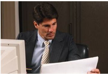
Proteja y organice el activo mas importante de su trabajo, la información...

Además de las características antes mencionadas le tenemos otra sorpresa, el precio esta realmente al alcance de su bolsillo.