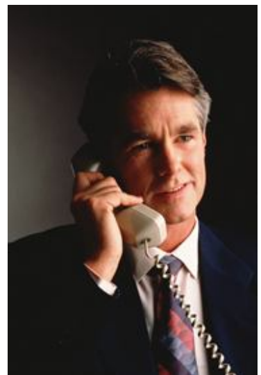
Nuestros consultores son personal altamente capacitado

Pregunte por este servicio le aseguramos que no se arrepentirá.