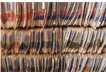
Olvídese de la administración de seguros basada en los documentos físicos. Recupere su espacio de almacenamiento.